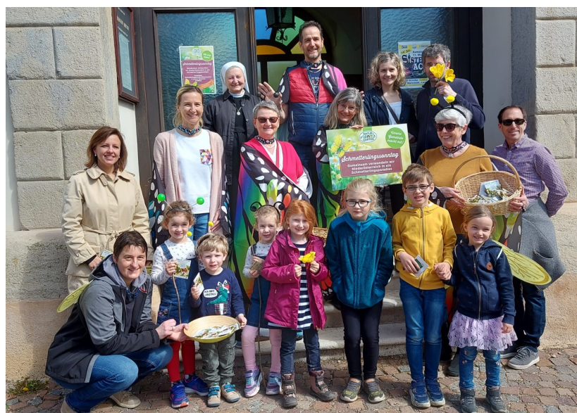
Nach der Kirche wurden von der Gemeinde „Natur im Garten“ Wildblumen Samensäckchen verteilt mit fleißiger Mithilfe einiger Kinder

Ein großes Problem für Nachtfalter ist die hohe Lichtverschmutzung. Die Falter umschwirren die Leuchtkörper die ganze Nacht bis zur Erschöpfung statt zu fressen oder sich zu vermehren. Daher gilt im Garten: „Licht aus!“