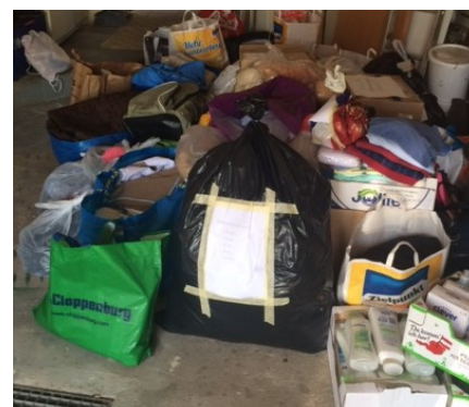
Das waren die letzten zwei Fuhren für Breitenfurt

Vielen, vielen Dank für Ihre Spenden! Ein besonderer Dank gilt auch zwei Kindern, die ihr Taschengeld für einen Spendeneinkauf im Drogeriemarkt opferten!