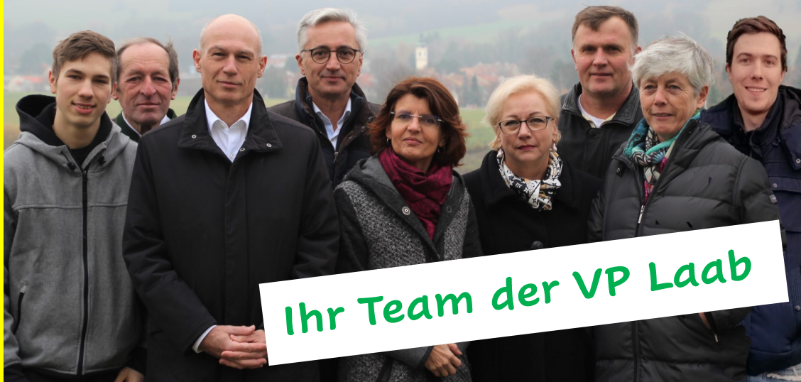
Ihr Team der VP Laab